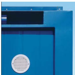
CEE-Anschluss im Rahmen versenkt