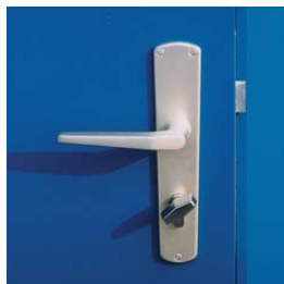
Türschnalle mit Drehgriff