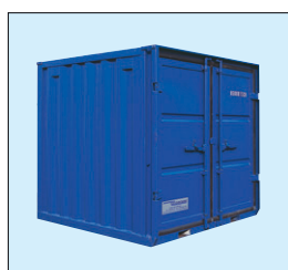
Typ LC 6'

Lagercontainer mit Sicherheitspaket sind in den Größen 6', 8', 10', 15' und 20' verfügbar: