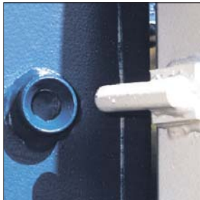
4 innenliegende Aushebesicherungen