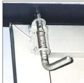
2 innenliegende verzinkte Verriegelungen