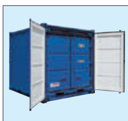
LC-Set Beispiel (LC 10' + 8')