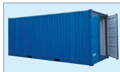
Typ LC 20'