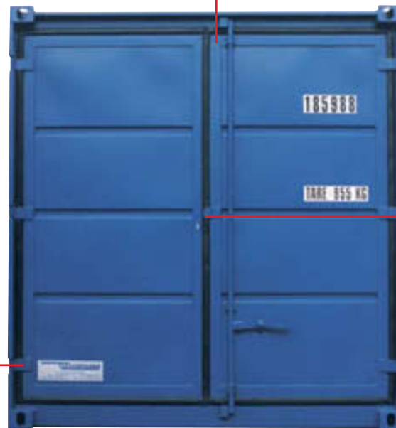
Lagercontainer mit Sicherheitspaket