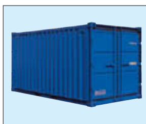
Typ LC 15'