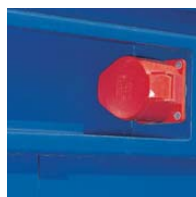
Versenkter CEE-Anschluss im Dachrahmen