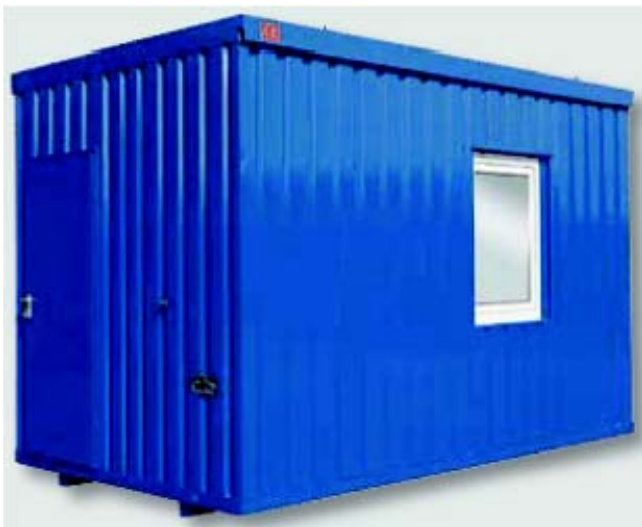
Beispiel mit Zusatzausstattung 6857 Außenwandlackierung