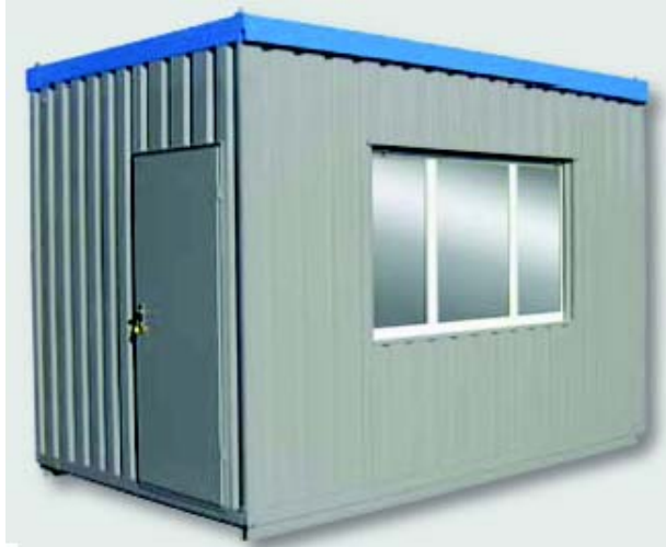
Beispiel 6857 mit Kontrastlackierung und nach rechts versetzter Tür.