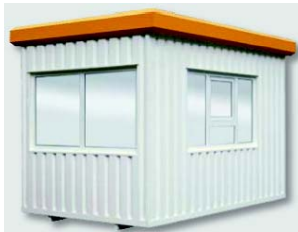
Beispiel mit Schalterfenster