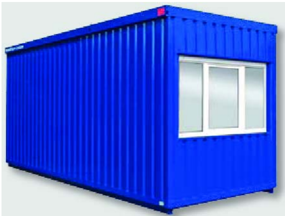
Beispiel 6802 mit Zusatzausstattung Außenwandlackierung