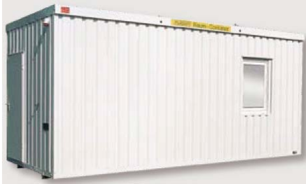
Beispiel Raummodul 6852 mit Zusatzausstattung Anbaugerätestecker