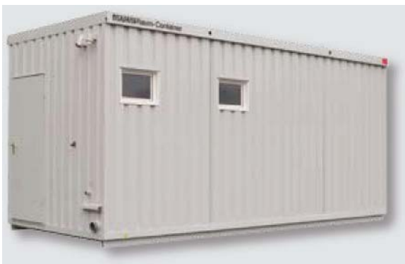
Beispiel 6860 mit Kippfenster und 2 CEE- Anbaugerätesteckern